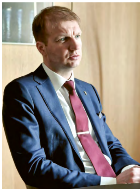
Kaspars Melnis, klimata un enerģētikas ministrs.

Jaunās tehnoloģijas ir drošākais veids, kā mazināt enerģijas izmaksas, tāpēc viens no gaidītiem Klimata un enerģētikas ministrijas (KEM) darbiem bija atbalsta programma mājsaimniecībām, lai arī nākamajos gados iedzīvotāji, pateicoties šai programmai, varētu uzstādīt savās mājās videi draudzīgas enerģijas ražošanas iekārtas. Piemēram, saules paneļus, siltumsūkņus, granulu katlus un citas tehnoloģijas, kas izmanto atjaunīgos enerģijas resursus. Ņemot vērā līdzšinējo Latvijas iedzīvotāju interesi par atjaunojamo resursu iekārtu nomaiņu pret modernām un zaļām iekārtām, Ministru kabinets apstiprināja Klimata un enerģētikas ministrijas izstrādāto regulējumu, tādējādi atstādams spēkā atbalsta programmu līdz