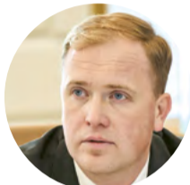
Ekonomikas ministrs Viktors Valainis