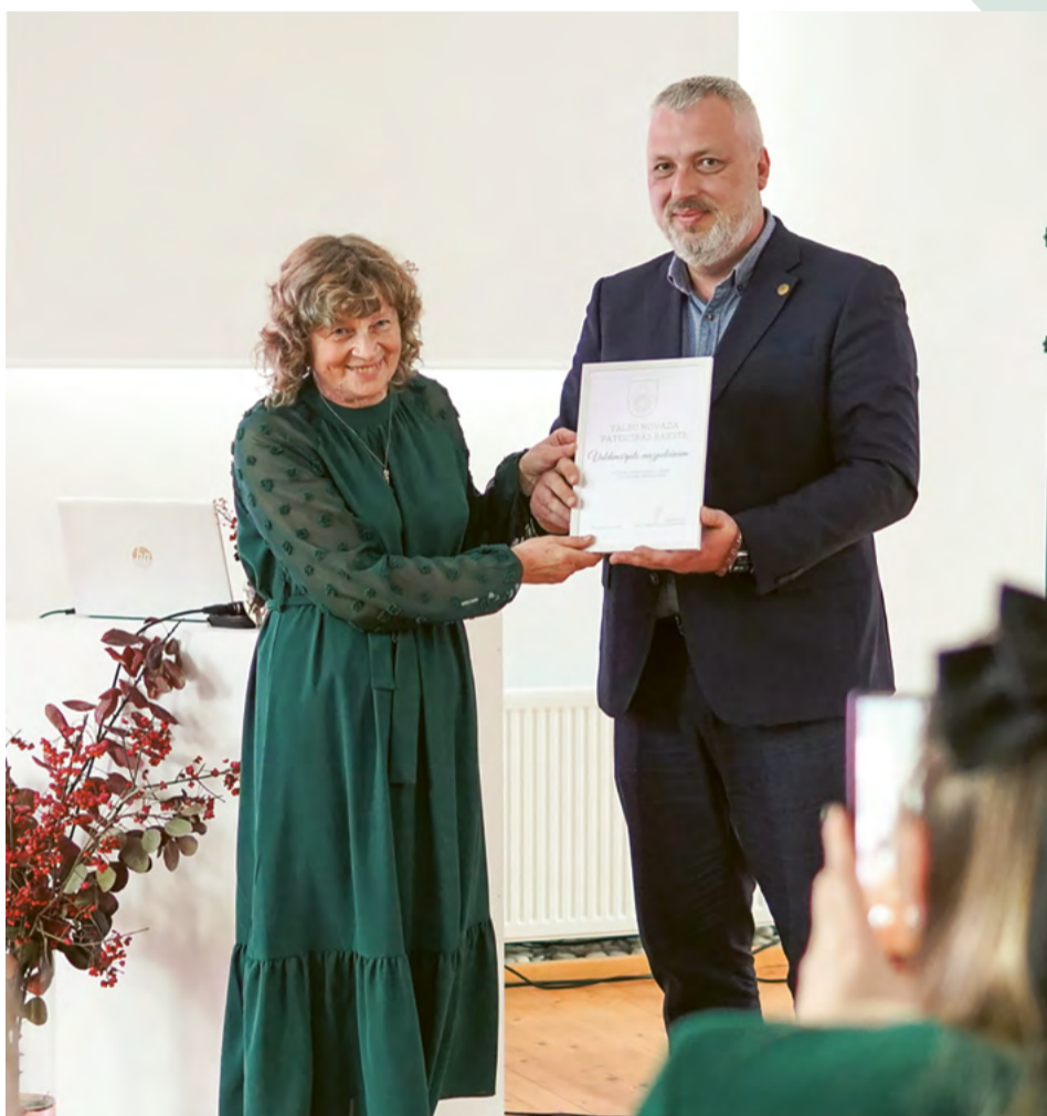
2024. gada 30. oktobrī Talsu novada tūrisma uzņēmēju un ar nozari saistīto speciālistu simpoziji, kas notika Sabiles mākslas, kultūras un tūrisma centrā. Simpozija laikā pateicības tika izteiktas visiem Talsu "Mājas kafejnīcu 2024" īstenotājiem.

normatīvie dokumenti. Praktiskajā sadarbībā liela nozīme ir arī cilvēcis-kajam faktoram. Manā redzējumā iedzīvotāju padomes ir kā pašvaldības neatņemama sastāvdaļa, proti, reizē palīgs un padomdevējs vietējām kopienām un pagastiem. 2024.gadā jau esošajā koalīcijā izdevās mainīt lēmumus, kurus pieņēma 2023.gadā un paredzēja, ka pašvaldība izstājās no daudzām NVO biedrībām. Uzskatām, ka tikai ciešā sadarbībā ar NVO varam veidot novadu stiprāku, tāpēc pašvaldība vai tās padotībā esošā iestāde saglabā dalību sporta, kultūras un citās biedrībās, tādējādi stiprinot arī ciešāku NVO sadarbību.