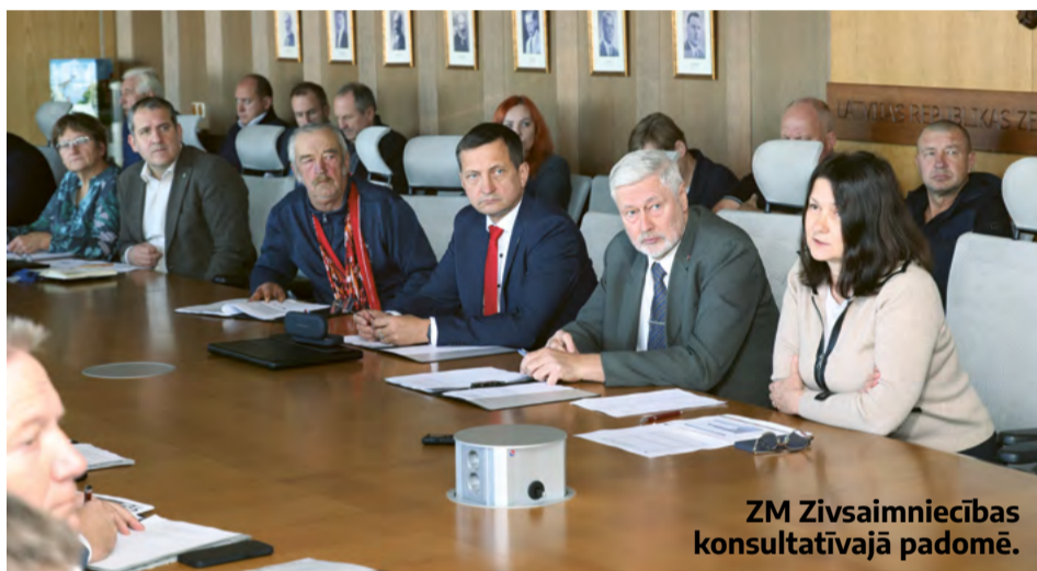
ZM Zivsaimniecības konsultatīvajā padomē.

soli un ieguldīt dabas un vides aizsardzībā. Bet nedrīkst būt tā, ka mēs, tā teikt, postalās un ar tukšu vēderu vēl pēdējās kapeikas atlicinām vides aizsardzībai un klimata pārmaiņām un brīnāmies, kāpēc mūsu konkurētspēja krītas. Tāpēc konkurētspēja ir pirmajā vietā.