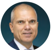
Latvijas Tirdzniecības un rūpniecības kameras prezidents Aigars Rostovskis