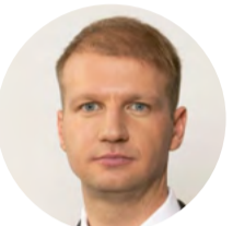
Klimata un Enerģētikas ministrs Kaspars Melnis