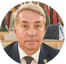
Labklājības ministrs Uldis Augulis