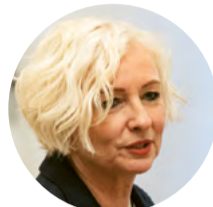
Saeimas priekšsēdētāja Daiga Mieriņa