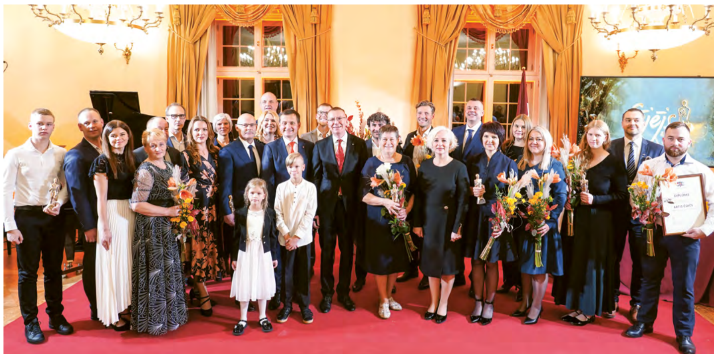
Zemkopības ministrs Armands Krauze kopā ar Valsts prezidentu Edgaru Rinkēviču un Saeimas priekšsēdētāju Daigu Mieriņu sveics "Sējējs 2024" laureātus.

Tāpat mums jāpārstāv savas intereses attiecībā uz vides jautājumiem, pirmajā vietā šobrīd paceļot ekonomiskos un cilvēku labklājības jautājumus. Ja mūsu cilvēku labklājības līmenis būs atbilstošs Eiropas vidējam, tad varam domāt par nākamo