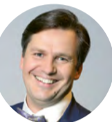
Žurnālists Ansis Bogustovs