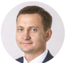
Zemkopības ministrs Armands Krauze